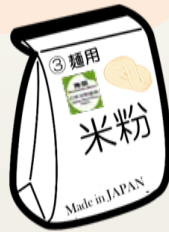
米 粉 の 用 途 別 基 準