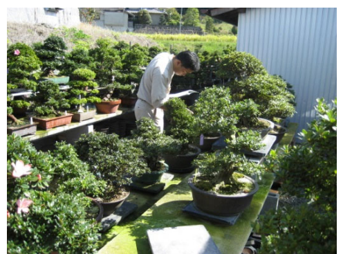
輸出検疫（盆栽の栽培地検査）