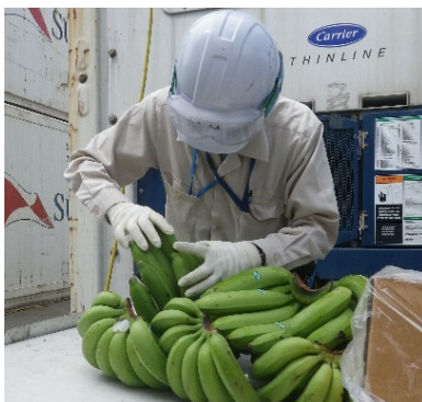
輸入検疫（バナナの検査）