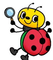
植物防疫所公式キャラクター「ぴーきゅん」

(お願い)消費者の部屋にご来場される際は、新型コロナウイルス感染症拡大防止の観点から、マスクのご着用をお願いします。