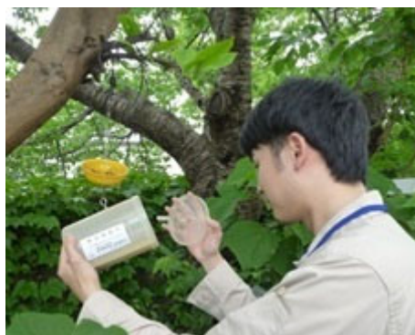
国内検疫（侵入警戒調査）