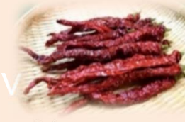
加工に使う唐辛子