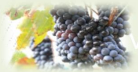
ワイン用のぶどう