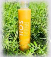
ジンジャーハニー