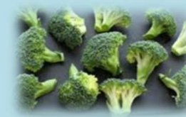
カットしたブロッコリー