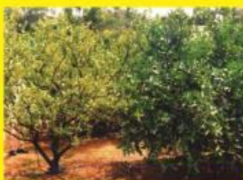
カンキツグリーンング病(左)

カンキツグリーンング病は、ミカンのなかまの木を枯らす病気で、ミカンキジラミという虫で伝搬します。沖縄、奄美など日本の一部に発生しています。