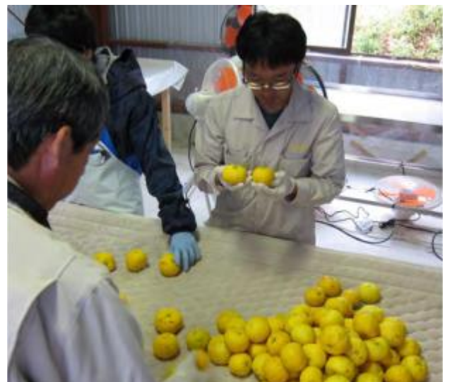
EU向けユズの集荷地検査(高知県)