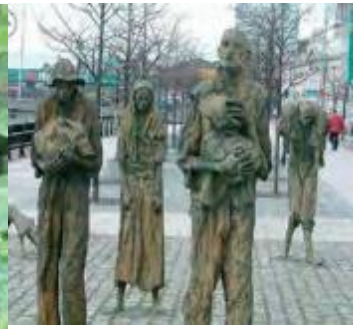
ダブリンにある飢餓追悼碑