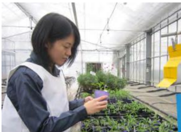
EU向け草本苗の栽培地検査(滋賀県)