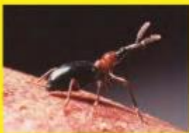
アリモドキゾウムシ