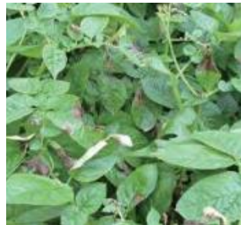
ジャガイモ疫病の茎葉

アイルランドは主にジャガイモを主食として食べていたため、深刻な食糧難となり、病気と飢餓のために80万人から100万人が亡くなりました。その後10年間でアメリカ、イギリス及びカナダなどへ200万人以上移住したといわれ、人口は半減しました。