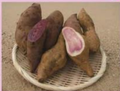
サツマイモ(紅イモ)