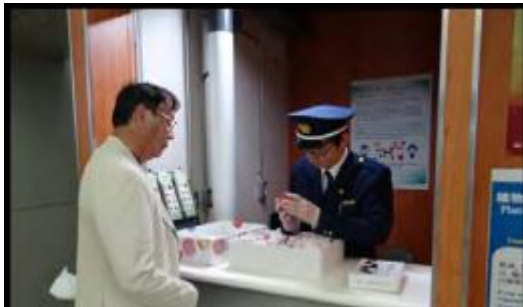
輸出検疫カウンター(関西国際空港)