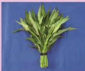
エンサイ(ウンチェーパー)