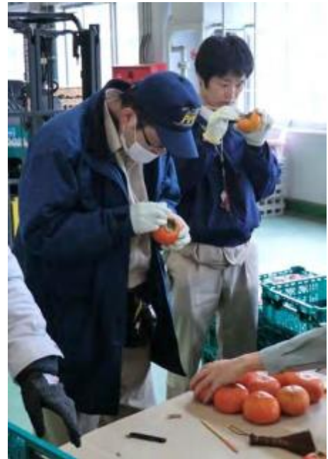
米国向けカキの集荷地検査(和歌山県)