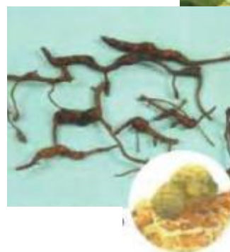
ブドウネアブラムシにより虫こぶができた葉と根