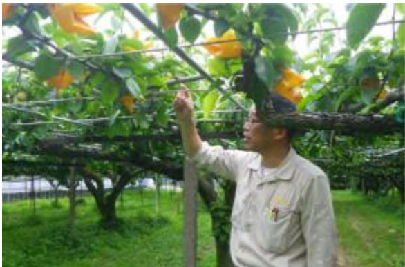
ベトナム向けナシの栽培地検査(徳島県)