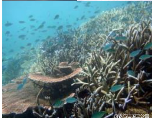
西表石垣国立公園