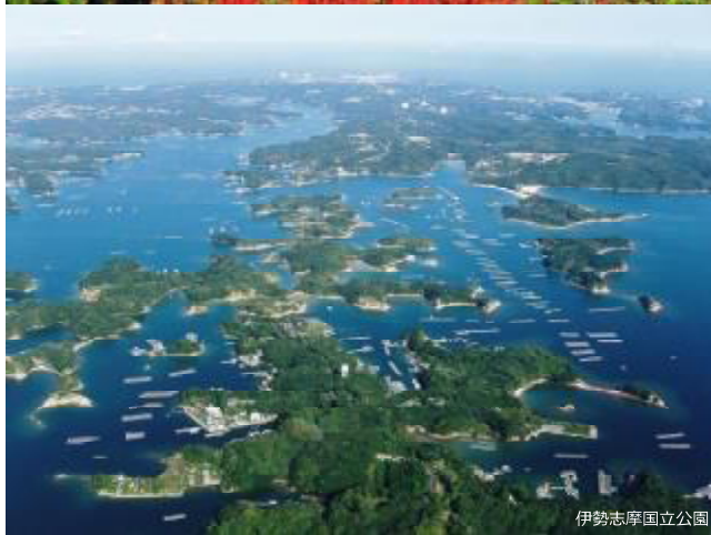
伊勢志摩国立公園