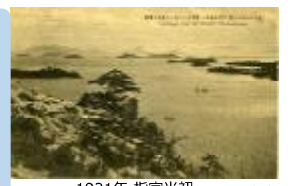
1921年 指定当初