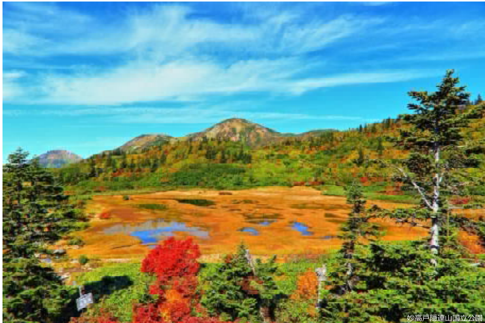
妙高戸隠連山国立公園

世界でも稀な、自然と人の暮らしがともにある国立公園。壮大な景色や手つかずの自然だけではなく、その土地で生きる人々が、自然と調和して作り出した暮らし・伝統文化・食など、そこにはさまざまな物語があります。