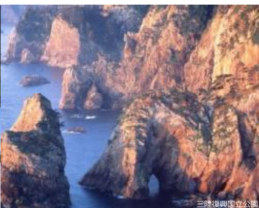
三陸復興国立公園