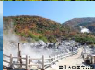
雲仙天草国立公園