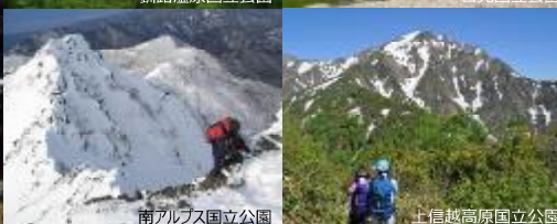
南アルプス国立公園