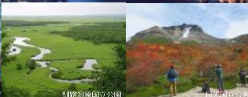
釧路湿原国立公園