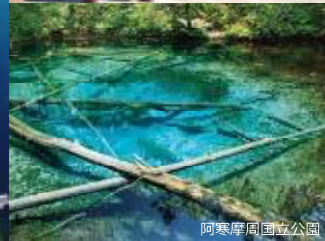
阿寒摩周国立公園