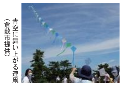
青空に舞い上がる連風