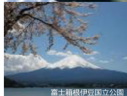
富士箱根伊豆国立公園