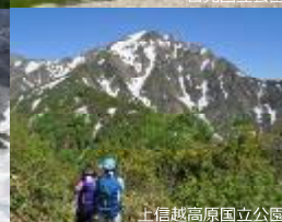
上信越高原国立公園

国立公園は、時代のニーズにあわせて指定が行われてきました。現在の多様な国立公園があるのは、時代とともに風景や自然の評価が変化・多様化してきたからです。