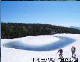
十和田八幡平国立公園