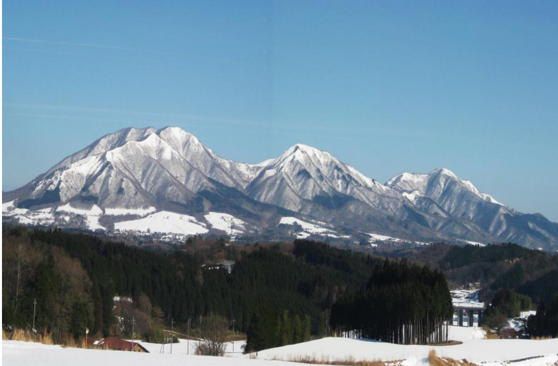
【冬の蒜山三座：蒜山国有林(真庭市)】