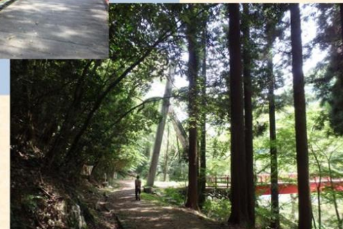
【新緑が美しい初夏の宇甘溪谷遊歩道(加賀郡吉備中央町)】

加茂山国有林のなかでも宇甘川に面する区域の一部は、吉備清流県立自然公園に指定されています。