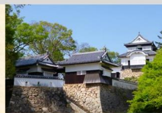
【17世紀末に完成した備中松山城（高梁市）】

市街地北端にそびえる「備中松山城」は現存する天守を持つ山城としては随一の高さを誇り、臥牛山国有林は、この城を取り囲む形で所在しています。