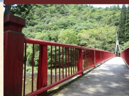
【宇甘溪谷遊歩道から赤橋を臨む(加賀郡吉備中央町)】

加茂山国有林のなかでも宇甘川に面する区域の一部は、吉備清流県立自然公園に指定されています。