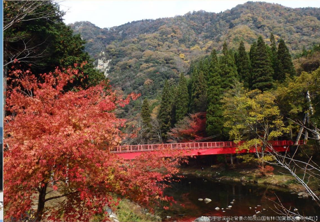
【秋の宇甘溪谷と背景の加茂山国有林(加賀郡吉備中央町)】