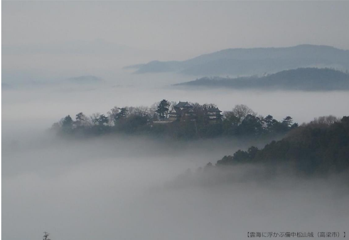
【雲海に浮かぶ備中松山城（高梁市）】