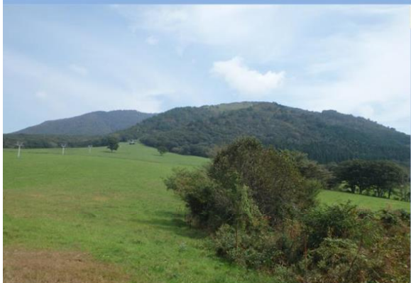
【西の軽井沢と称される蒜山高原：蒜山国有林(真庭市)】

蒜山国有林は、大山・隠岐国立公園のなかに所在し、鳥取県との県境に位置する鬼女台からは、蒜山三座と蒜山高原の雄大な景色を堪能することができます。また、蒜山国有林は、登山道、展望所等からブナ、ミズナラ等を含む高齢級天然林の優れた景観を望見することができます。