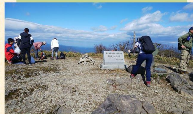
【那岐山山頂・那岐山国有林（宗義町）】

氷ノ山後山那岐山定公園内、岡山県奈義町と鳥取県智頭町の県境にある「那岐山」は、国造りの神様が登場する伝承を持ち、古くは行場でもあった秀峰で、三百名山となっています。