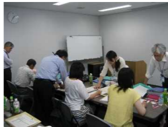
経営統計の研修の様子

経営統計を担当しています。農家が使用されている農薬や肥料については、多くの種類があり、統計調査の大変さを実感しました。本業で行政書士事務所を開業しており、農家の経営の実態を肌で感じる良い機会となっています。