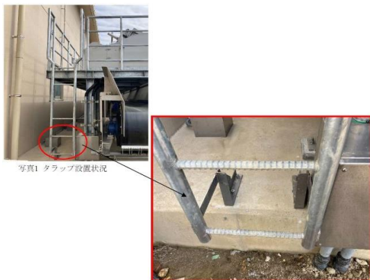
<点検時の安全性を向上>