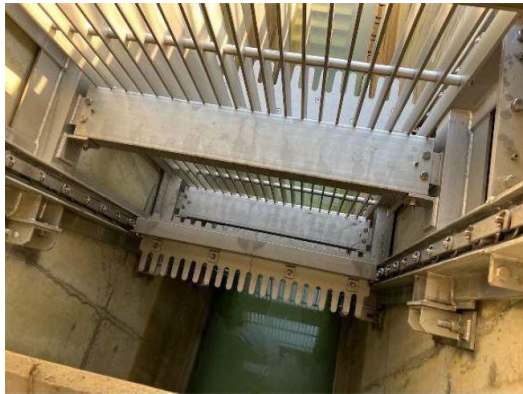
<維持管理の容易性を向上>