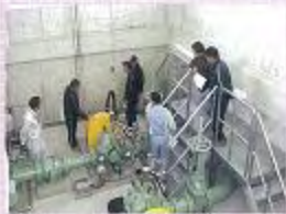
施設の操作説明会の様子

今回、一部地区ではあるが試験散水で水が飛ぶようになったのを見て感無量であった。この水を利用して、より良い甘しょや大根ができるように頑張りたい。