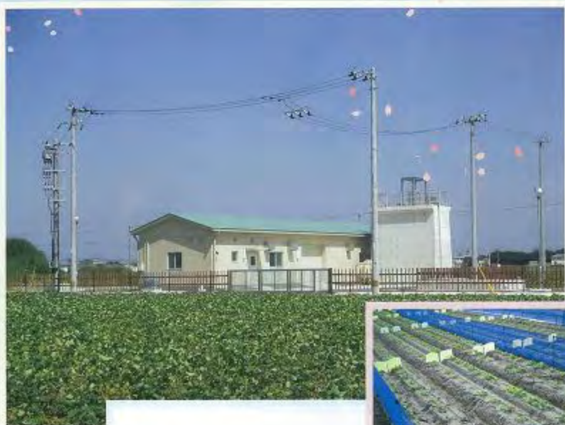
里浦揚水機場 (鳴門市)