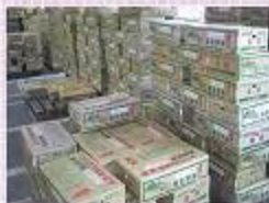
出荷されるのを待っています!