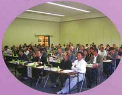
臨時総代会: H20.10.16 板野町町民ふれあいプラザ

総代選挙を経て平成 20 年 9 月 24 日に吉野川下流域土地改良区の新しい総代さんが、また 10 月 16 日の臨時総代会にて新しい役員さんがそれぞれ決まりましたのでご紹介します。【任期 4 年】