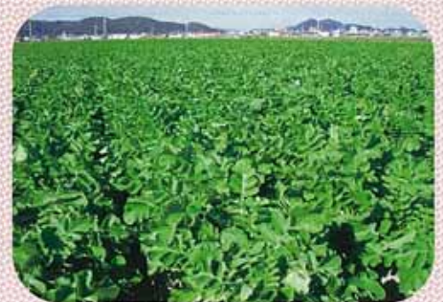
だいごんの栽培状況(裏作)