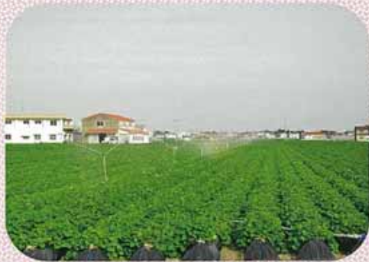
なると金時の栽培状況 (スプリンクラーかんがい)

国営幹線水路の全線完成による吉野川からの一日も早い本通水に大きな期待が寄せられています。 【徳島県 農地整備課】