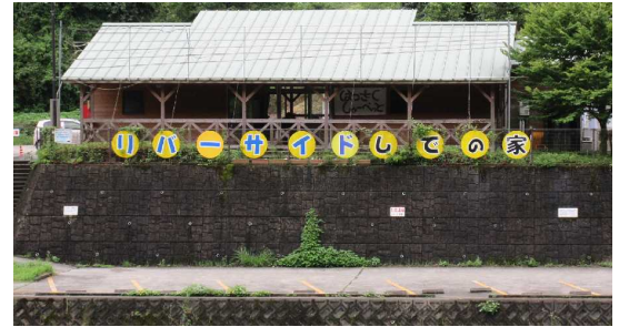
(リバーサイドしでの家)

また、地元の八朔やブルーベリーなどを原料に委託加工した7種類のアイスクリームも販売しています。5年前から販売を開始した栗を用いたアイスクリームは、栗の量が多すぎても少なすぎても良い味にならず、加工の委託先とともに試行錯誤し、2年あまりを経て商品化されました。栗は固いのでカップでの提供のみですが、他の種類はコーンかカップいずれか好きな方を選ぶことができます。