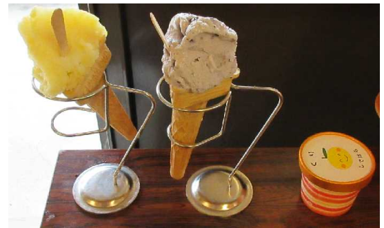
(はっさくシャーベット) (栗アイス) (ブルーベリーアイス)