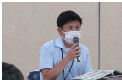
(徳島県拠点担当者による説明の様子)

徳島県拠点は、新型コロナウイルス感染症に対する支援制度について、県の機関や市町村、J A等に対して個別訪問により説明を行っています。