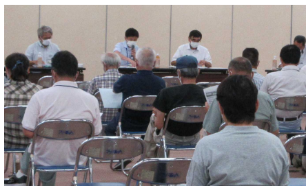
(J A アグリあなん説明会場の様子)