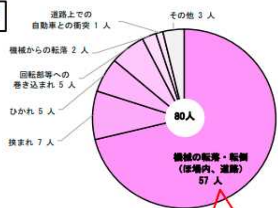
乗用型トラクター事故による死亡の要因（令和元年）