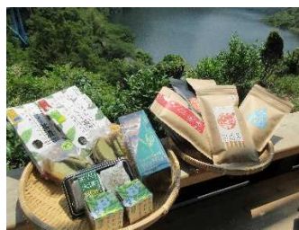
（お茶やクッキーなど）