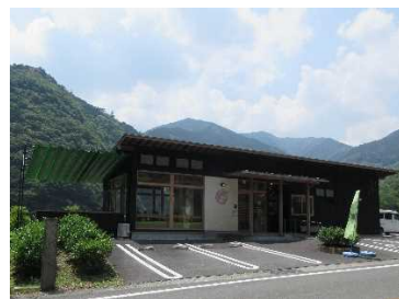
（仁淀川町のカフェ）