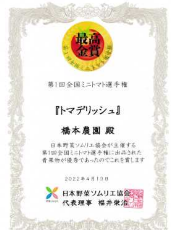
最高金賞受賞のトマデリッシュと表彰状