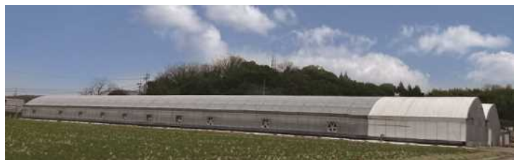
橋本農園ハウスの全景