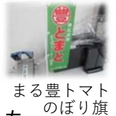
まる豊トマトのぼり旗

神石高原町では、約50年前に旧神石郡豊松村でトマトの施設栽培を本格的に開始し、1980年には「神石高原まる豊トマト生産出荷組合（以下、組合という。）」を設立し、産地形成の一翼を担ってきましたが、生産農家が減少傾向となり、その状況を打開すべく、組合として1997年に「アグリパーク陽光（ひかり）の里トマト団地」を造成しました。