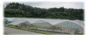
アグリパーク陽光の里トマト団地

本年、組合（生産農家38戸）では、栽培面積約10ヘクタール、出荷量1,300トンを見込んでいます。