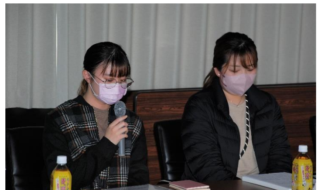
発言する今治明德短期大学の学生

交流会では、出席者に「私が農林水産大臣なら」と題して、主張や提案をしていただきました。農業者からは「都市部の消費地へ農産物を送るのは、輸送コストによる地域格差が大きい。輸送費の一部を補填する仕組みがあれば、収入が安定する。」などの発言があり、学生からは「開発によって農地が減少しているのは、食料安全保障上、問題である。農地転用をする際にはその分、耕作放棄地を農地に戻すことを義務付けるなどの対策が必要ではないか。」といった発言がありました。