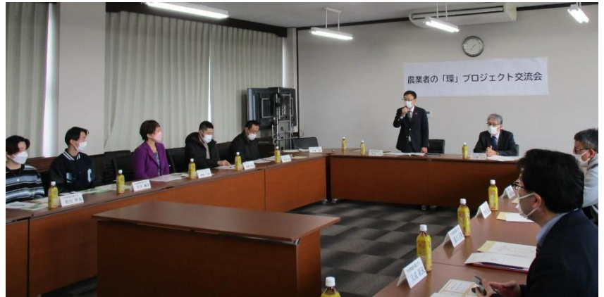
農業者の「環」プロジェクト交流会の様子