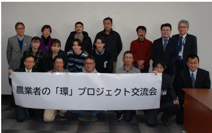
参加者のみなさん

意見交換の後、学生が丹精する構内の「めいたん・ベジファーム」を見学し、栽培している農産物の説明や土づくりの話などでフリートークも盛り上がりました。