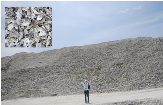
カキ殻の風景（全国で排出される年間のカキ殻は約16万トン）

今後は、森・里・川・海の連携した取組として、農業と漁業、地域・企業・人をつなげ、地域全体が活性化し、全ての人々が笑顔でつながる持続可能な取組となることを目指されています。