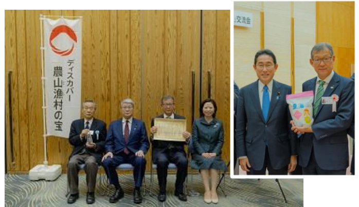
選定証授与式後の記念撮影（総理大臣官邸）

農林水産省及び内閣官房が行う「ディスカバー農山漁村（むら）の宝」は、強い農林水産業や美しく活力ある農山漁村の実現に向けて、農山漁村の有するポテンシャルを引き出すことにより、地域の活性化や所得向上に取り組んでいる団体や個人を優良事例として選定し、全国へ発信するものです。