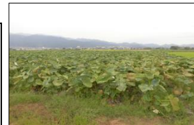
さといもの栽培ほ場

年間を通して安定した農作業の確保、単位面積当たりの収益性の向上、女性・高齢者の活躍の点から、さといも等を導入している。栽培技術の習得等のため、全構成員が積極的にJAや県の指導を受け、栽培技術の高度化を図ることで安定的な収量確保や良質な作物生産に繋がり、徐々に生産規模を拡大している。