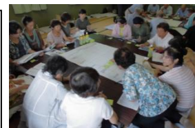
女性部による ワークショップの様子

構成員の年齢構成が高齢化し、今後の法人の存続が難しくなることが想定されることから、平成29年度から農業大学校の研修生を2名受入れるなど新規就農者の確保に努めている。また、女性部では、積極的な農作業への参加や視察研修の開催で見識を広げており、ワークショップなどを通じて仲間づくりと女性の活躍の場を広げている。