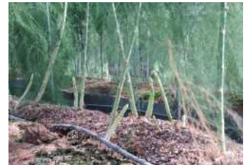
パイプハウス内の様子

アスパラガスを植えてから10年ほど経つと樹勢の衰えとともに収量が下がってきたため、高畝栽培や施肥の工夫等独自の取り組みの結果、樹勢が回復し、アスパラガスを植えてから16年目の現在でも高い収量を維持している。