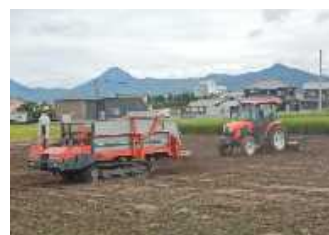
堆肥散布車（左）と トラクター（右）

草刈りにかかる労力を省力化するため、除草剤と草刈り機を併用して作業し、組合員だけでなく近隣の定年退職者など外部雇用を活用して対応している。