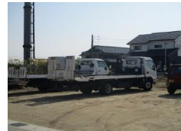
農機運搬用トラック

水稻栽培では、元肥一発施肥や自動給水装置の設置による水位調整に取り組んでおり、見回り等を含む作業時間の縮減により省力化が図られている。また、農業用機械はトラック運搬により自走時間の軽減を図っている。