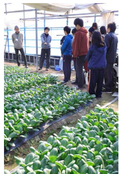
写真3 加茂谷体験ツアー

実際に移住就農を目指すため、2回目、3回目と必要に応じて相談会や見学・作業体験会を開催している。その結果、平成27年に30代の夫婦1組が移住して営農準備研修を開始し、翌年独立営農を開始している。また別の40代夫婦1組も移住就農を実現させている。いずれの夫婦も空き家を改装、中古ハウスを補修して暮らしている。平成29年の農業体験ツアーでは、移住就農を果たした彼らが新規就農希望者に対して農作業の実演を行い、移住就農した体験談を語った。実体験ゆえの説得力は高く、プラスの連鎖が生まれようとしている。