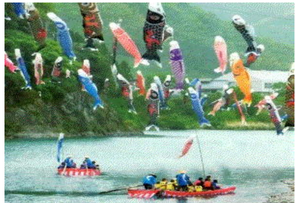
写真1 加茂谷鯉祭り

このような閉塞した流れを断ち切るため地元有志らにより、子供たちが健康で心豊かな人間に育つことを願うとともに、加茂谷地区の活性化を図る目的で「加茂谷鯉祭り」が平成元年より開催されてきた。最大2千匹もの鯉のぼりを川越しに渡し、様々なイベントを開催している。