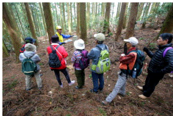
写真5 遍路道ウォーク

「加茂谷へんろ道の会（遍路道部会）」は遍路道の価値を活かすため、保全整備と魅力発信の活動を先進的に取り組み、ウォーキングイベント開催、ガイド活動、広報誌の発行、マップ作成などを行っている。加茂谷地区に残る歴史的遺産、自然遺産など地域の資源を活かした取り組みにより、山歩きや自然散策の新しいスポットとして徳島県内外に認知され、多くの人々が訪れる地域になってきている。平成28年度には「とくしま環境県民会議」表彰を受賞している。さらに、「四国八十八ヶ所霊場と遍路道の世界遺産登録推進協議会」の活動でも中心的な役割を担い、四国4県の各種団体とも連携し活動している。