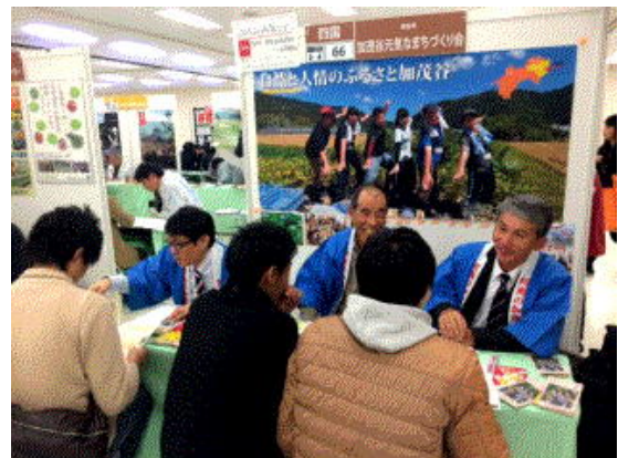
写真2 新・農業人フェア

「農業部会」においては、平成26年度から都市部（東京・大阪）での「新・農業人フェア」に加茂谷元気なまちづくり会として出展している。加茂谷のブースでは地域住民（農家）が先導して移住就農誘致へ向けて地域をPRし、実体験に基づき農業や農村生活の良さ、そして農業で食べていくことの難しさも誠実に説明している。