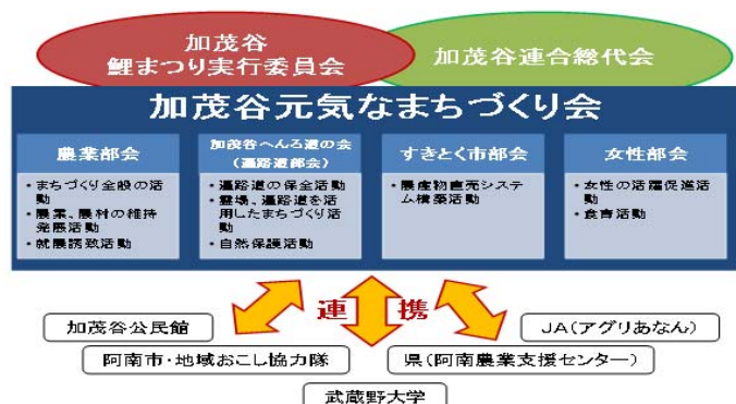
第2図 むらづくり組織体制図