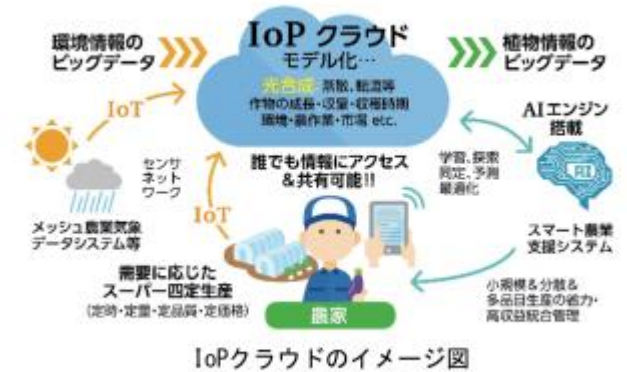
IoTクラウドのイメージ図

SAWACHIは県内の生産者が誰でも利用でき、より多くの生産者にデータに基づいて生産性を高める「データ駆動型農業」を実践してもらい、「もっと楽しく、もっと楽に、もっと儲かる」農業の実現を目指している。