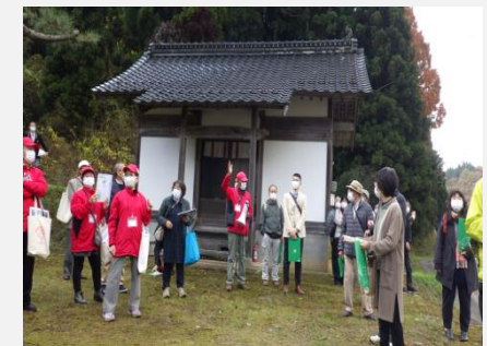
史跡・歴史ガイドの様子