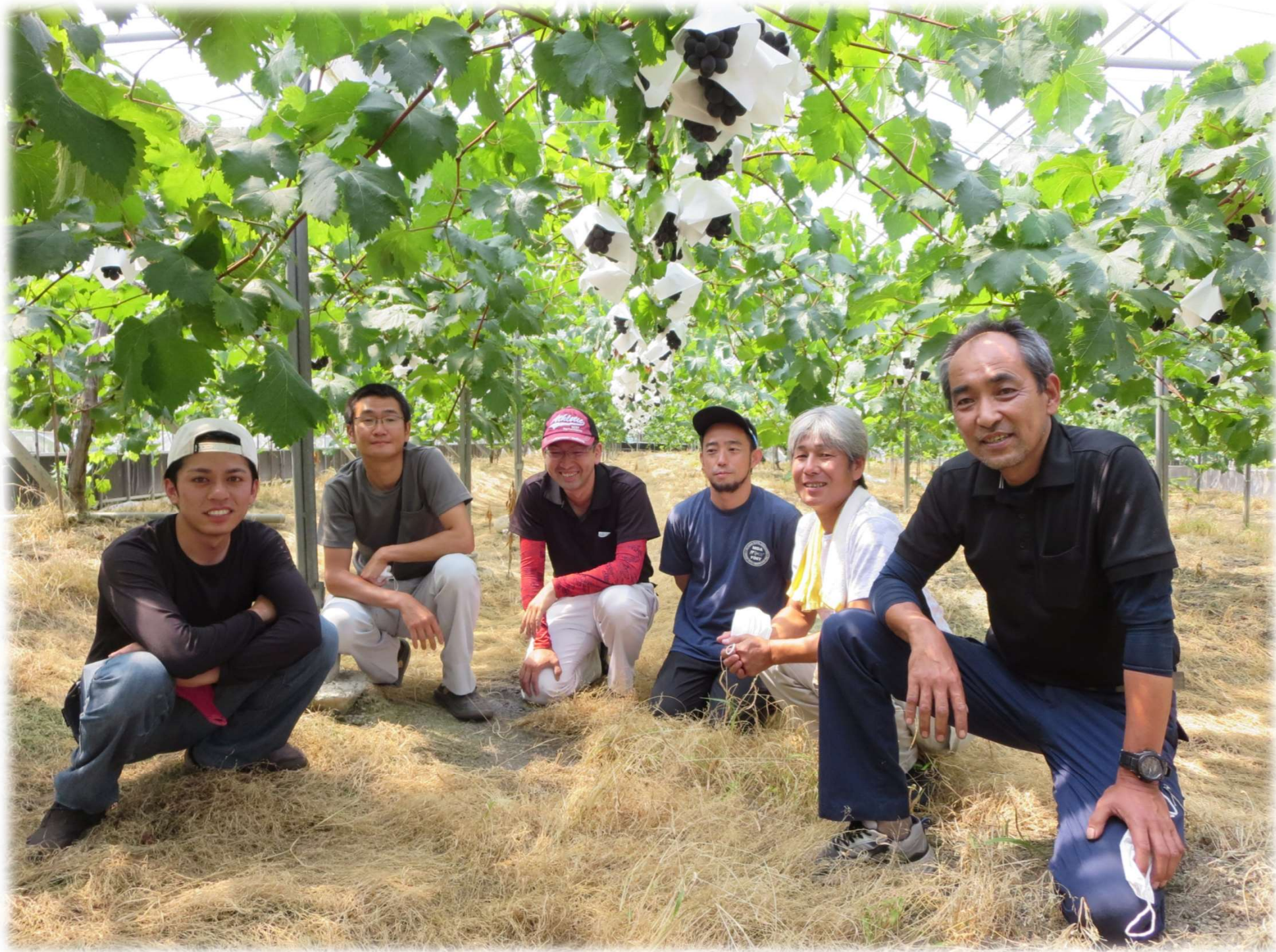
「三藤師匠とお弟子たち」