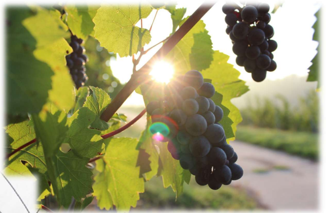
「収穫を待つぶどう」