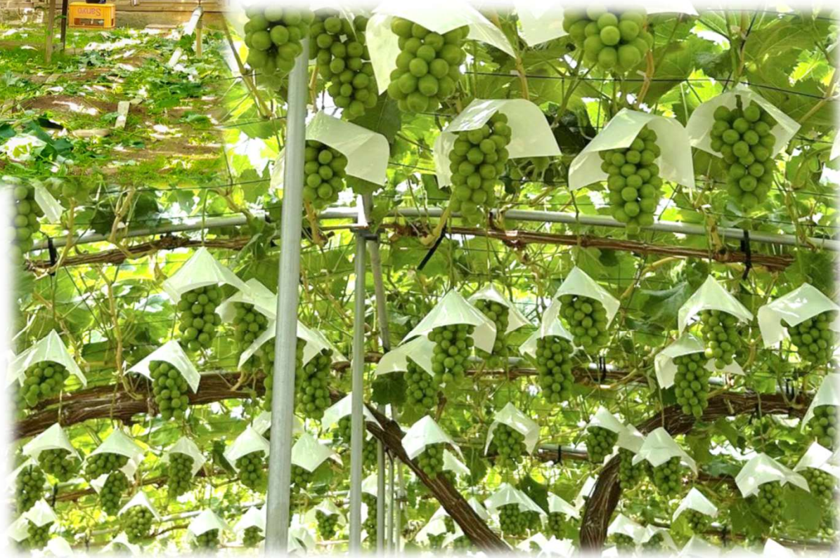
「収穫を待つぶどう」