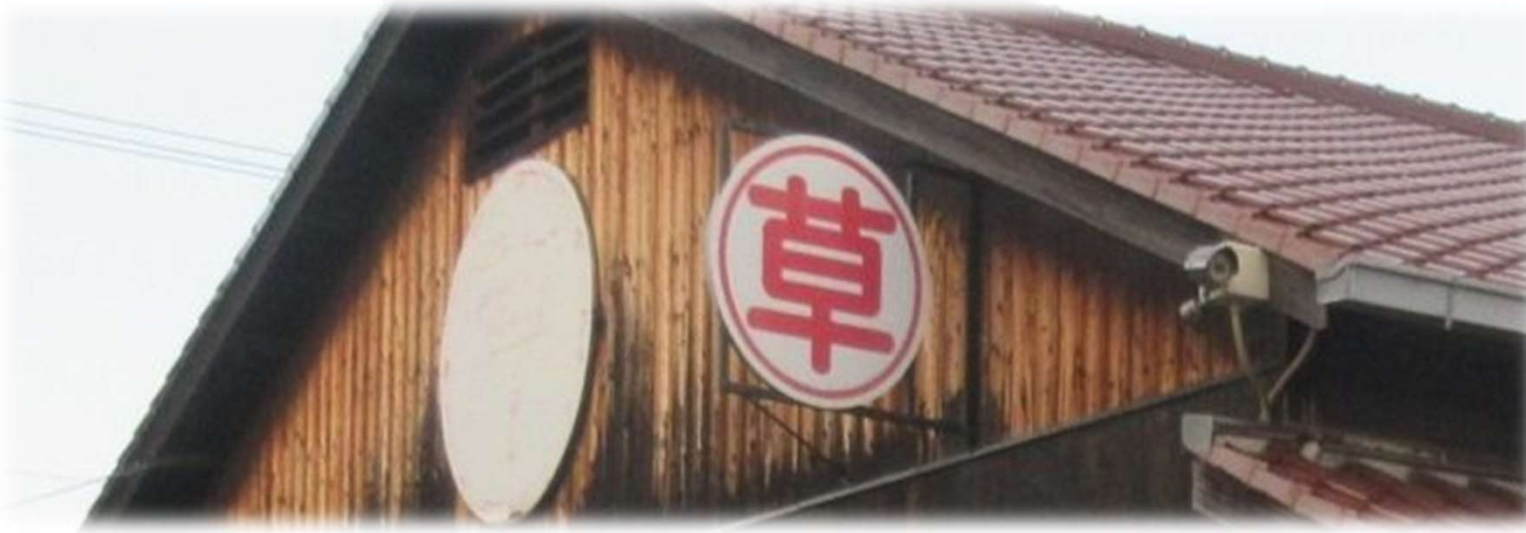
「丸草出荷組合のロゴ」