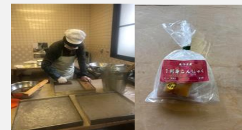
こんにゃくの製造と商品