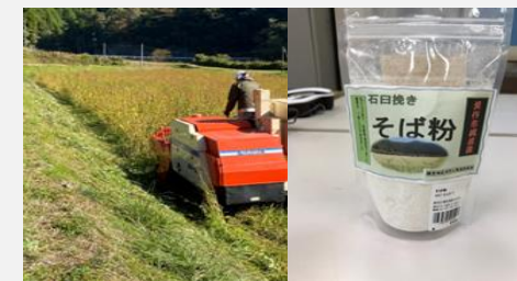
そばの収穫と商品