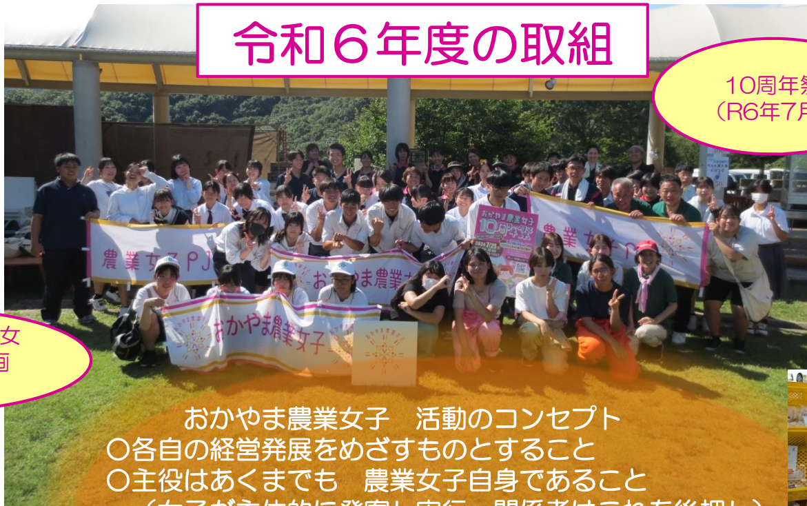
ノートルダム清心女子大学コラボ企画 (R7年2月)