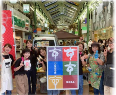
今年初参加の無印良品主催の「岡山つながる市」 (3年10月、12月)