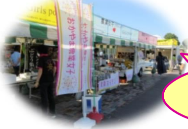
おかやま農業女子収穫祭 in吉備SA下り線 (2年9月)