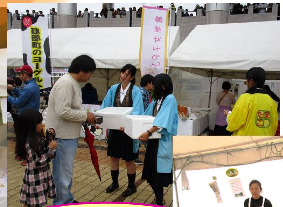
吉備高原フェスタ with興陽高校 (26年10月)