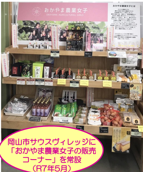
岡山市サウスヴィレッジに「おかやま農業女子の販売コーナー」を常設 (R7年5月)