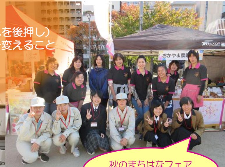
秋のまちはなフェア (30年11月)