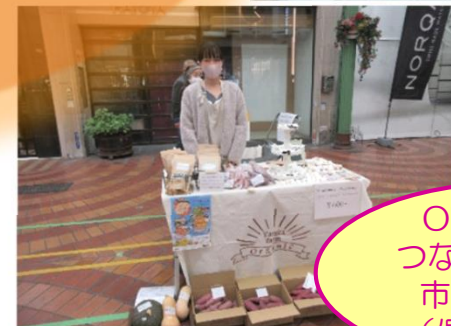
OKAYAMA つながる市/岡山市表町商店街 (偶数月開催)

毎月第1水曜日、岡山シティエフエムがタ方に放送している「タ刊ラジオ〜レディオモモ」に、おかやま農業女子のメンバーが月替わりで出演し、自身の農作物の紹介と農業・食に関するコメントをしました(画像はありません)。