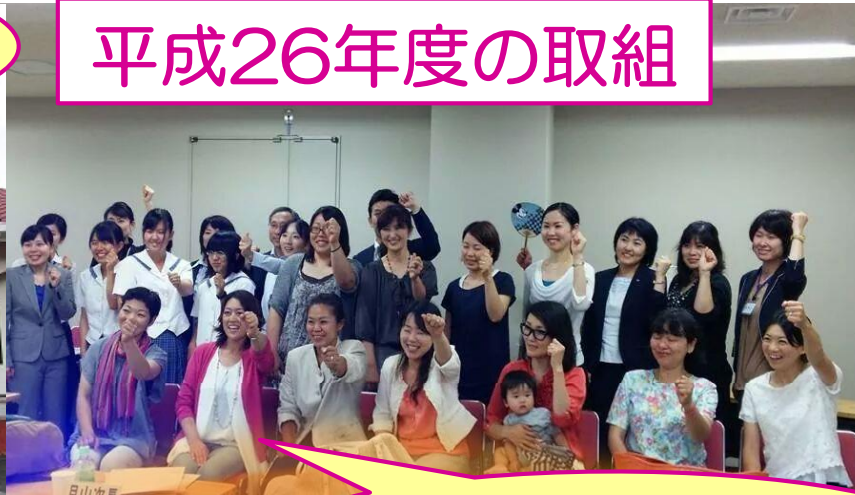
農業女子プロジェクトin岡山 (26年7月)