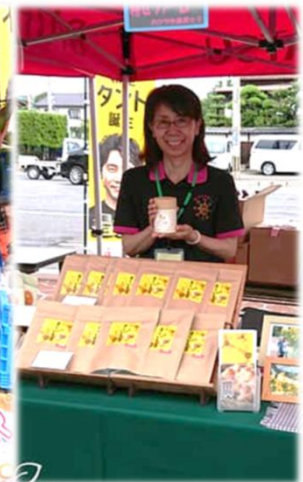
ダイハツマルシェ (元年7月)