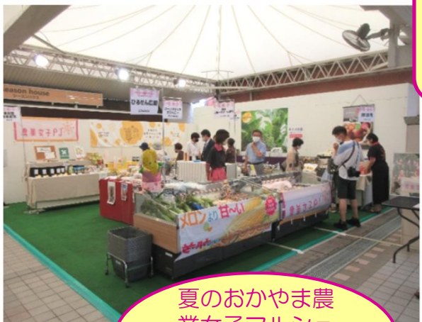
夏のおかやま農業女子マルシェ /天満屋 (R4年7月)