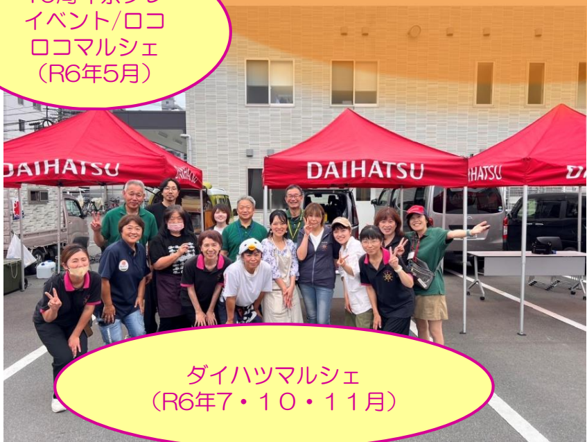
ダイハツマルシェ (R6年7・10・11月)