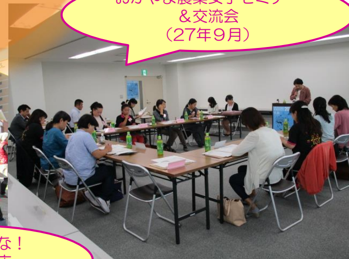
おかやま農業女子セミナー &交流会 (27年9月)