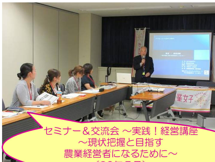
セミナー&交流会 ~実践！経営講座 ~現状把握と目指す 農業経営者になるために~ (30年5月)