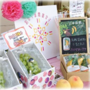
夏のおかやま農業女子マルシェ (3年7月)