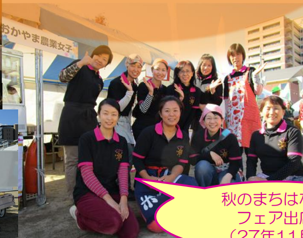
秋のまちはな! フェア出店 (27年11月)