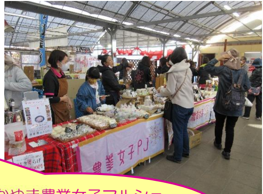
農マル園芸吉備路農園内には、おかやま農業女子コーナーが新設されました。