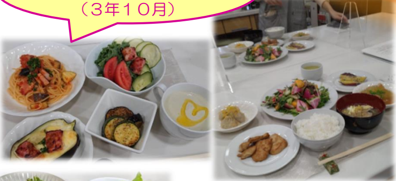
岡山ガス×おかやま農業女子コラボ料理教室 (3年10月)