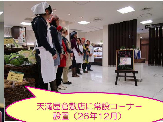
天満屋倉敷店に常設コーナー 設置 (26年12月)