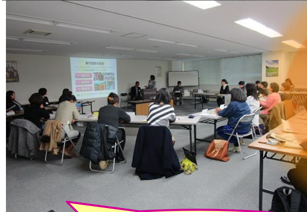
おかやま農業女子応援セミナー & 交流会 (26年12月)