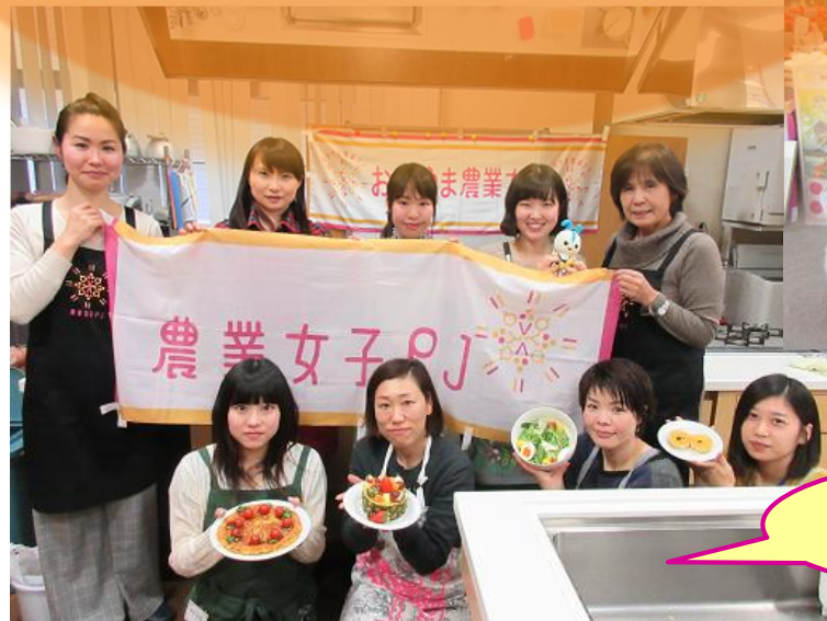
レオパレス21との 料理教室 (30年12月)