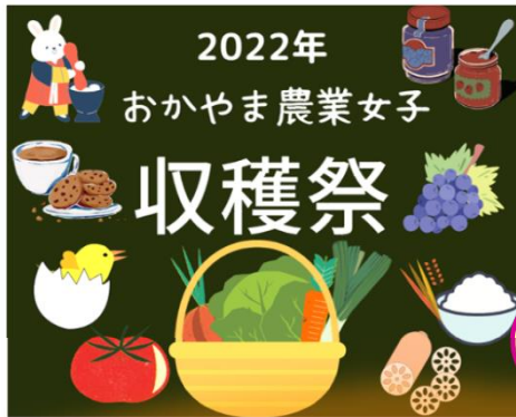
収穫祭 /吉備SA下り線 (R4年11月)