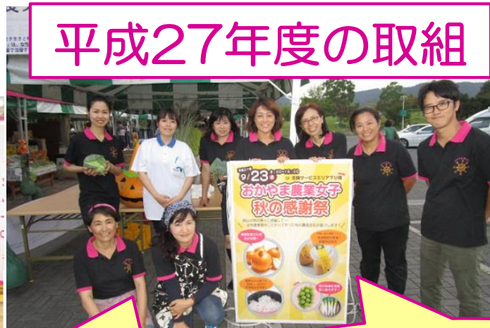
吉備SA下り線に常設 コーナー設置 (27年4月)