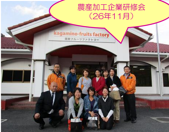
農産加工企業研修会 (26年11月)