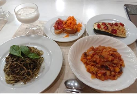
岡山ガス×おかやま農業女子 コラボ料理教室 (2年7月)

おかやま農業女子 活動のコンセプト ○各自の経営発展をめざすものとする ○主役はあくまでも 農業女子自身であること (女子が主体的に発案し実行、関係者はこれを後押し) ○積極的な情報発信を通じて農業のイメージを変えること