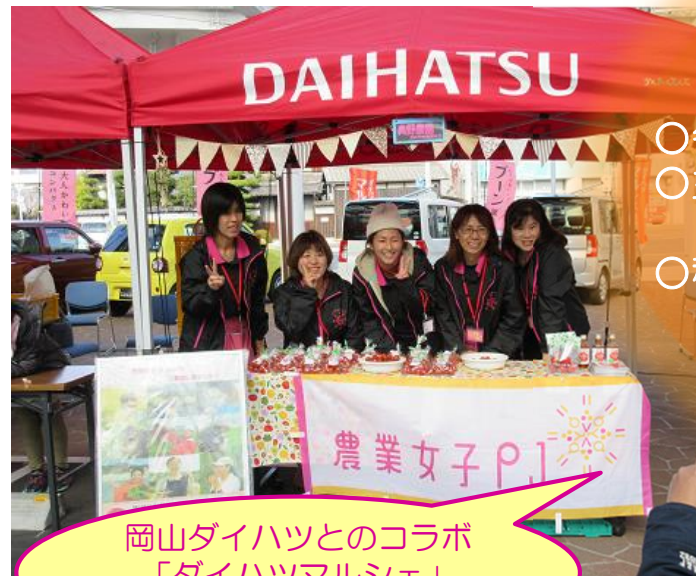
岡山ダイハツとのコラボ 「ダイハツマルシェ」 (30年11月)