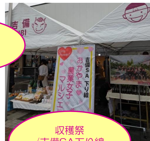
収穫祭 / 吉備SA下り線 (R6年11月)