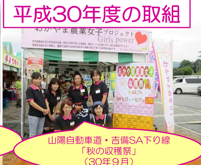
山陽自動車道・吉備SA下り線 「秋の収穫祭」 (30年9月)