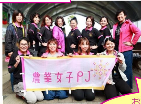
おかやま農業女子マルシェ in農マル園芸吉備路農園 (2年11月)