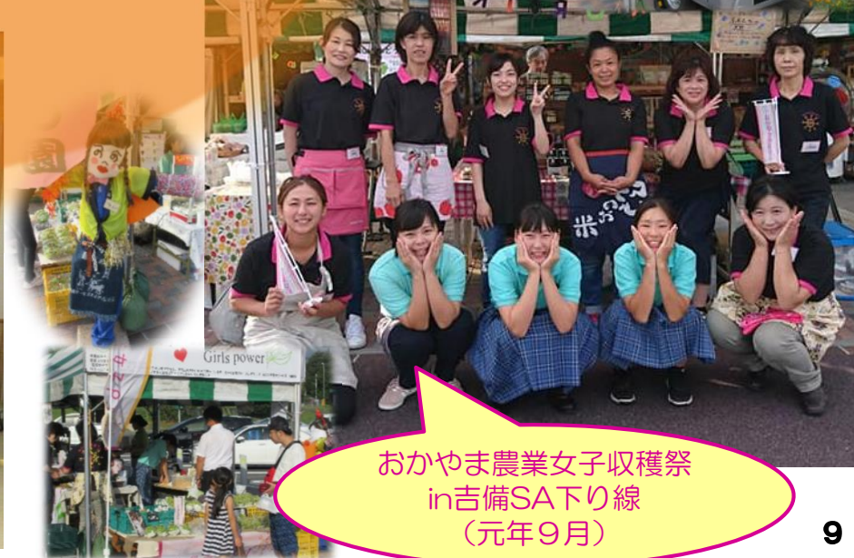
おかやま農業女子収穫祭 in吉備SA下り線 (元年9月)