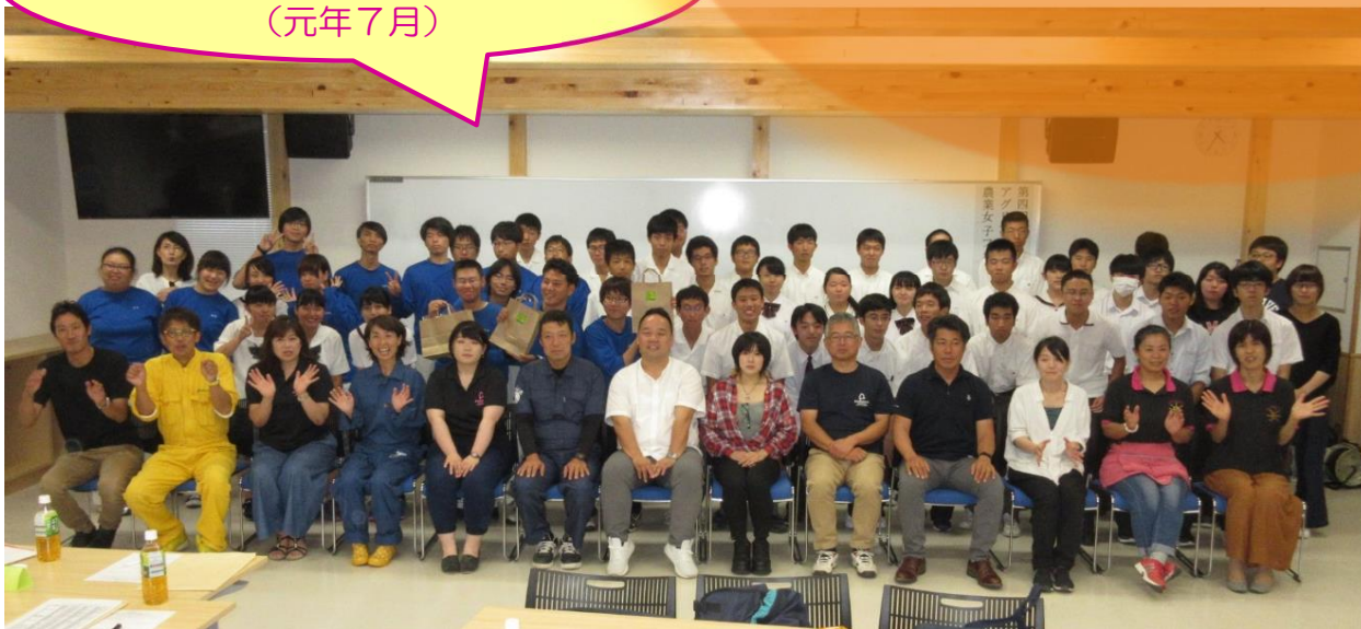
第4回アグリ・夢・みらい塾 兼農業女子フォーラム (元年7月)