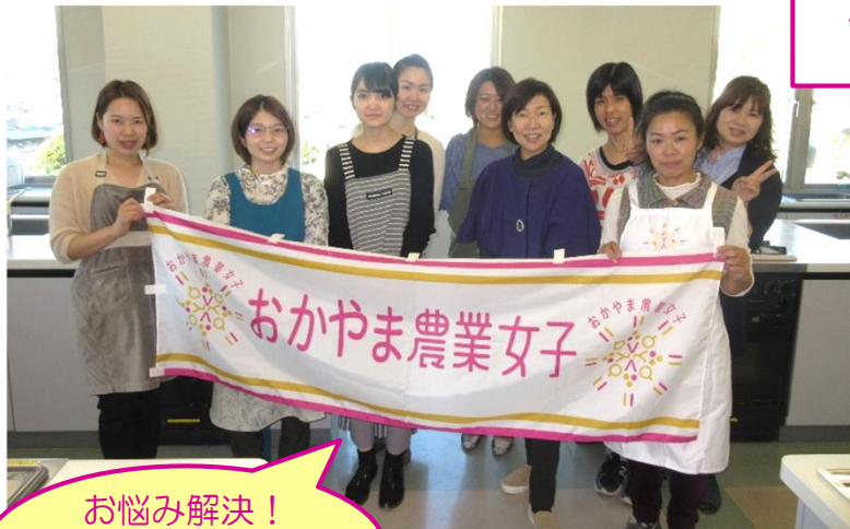
お悩み解決！ お料理教室 (31年4月)