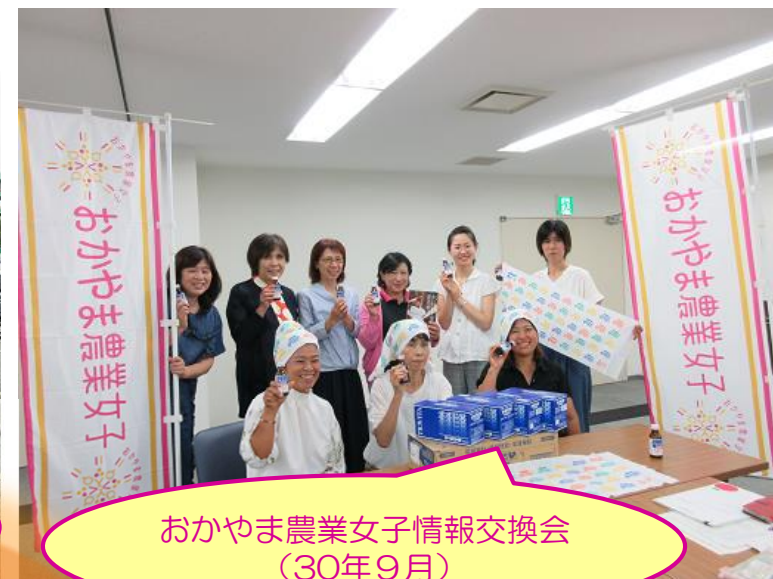
わかやま農業女子情報交換会 (30年9月)