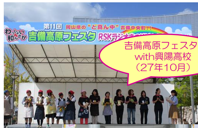
吉備高原フェスタ with興陽高校 (27年10月)