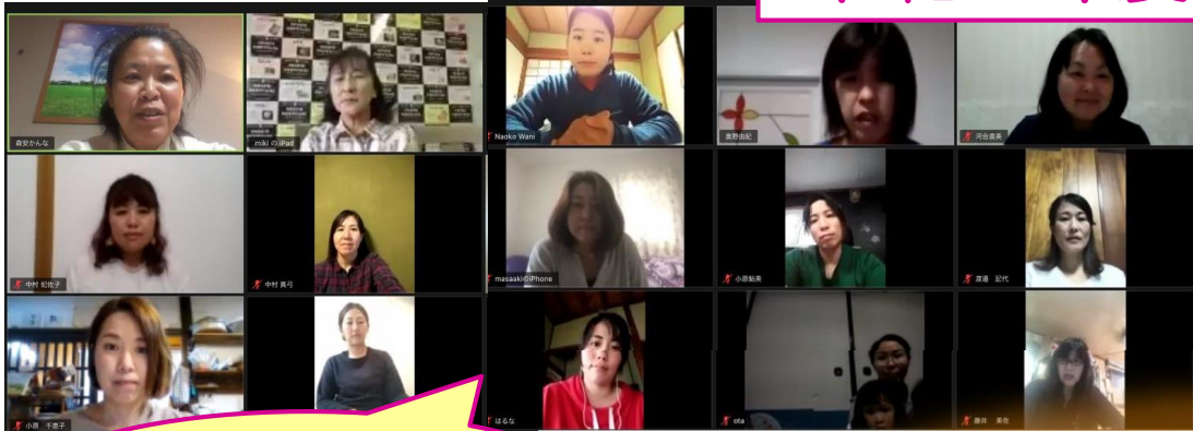
Webを利用した交流会 (2年5月)