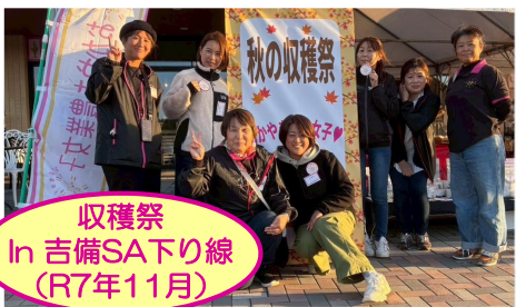
収穫祭 In 吉備SAT下り線 (R7年11月)

おかやま農業女子 活動のコンセプト ○各自の経営発展をめざすものとする ○主役はあくまでも 農業女子自身であること (女子が主体的に発案し実行、関係者はこれを後押し) ○積極的な情報発信を通じて農業のイメージを変えること