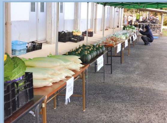
お手頃価格の採れたて野菜がズラリッ！