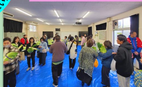
旬の野菜を両手いっぱい♪