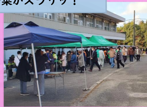
農場祭のスタートと同時に目的の野菜をGET！