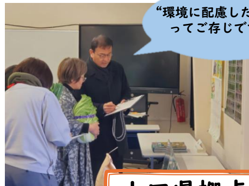
山口県拠点 情報発信コーナー

当日は、6月から山口大学の水田で行った生き物観察や農業と環境保全のつながり、みどりの食料システム戦略などの取組を紹介するパネル展示を行いました。