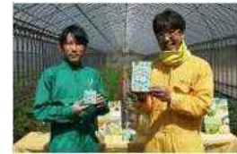
2021 年国和産業株式会社コラボ パクチーゼリー完成