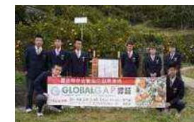
柑橘 11 品目でグローバルGAP 認証取得