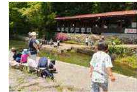
子供から大人まで楽しめる釣堀施設