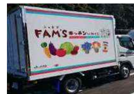
遠隔地の産物を集約する巡回トラック