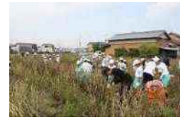
大野小 5 年生児童の「大野豆」 収穫作業