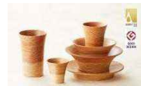
スギにしか出来ない赤白の杵目が 美しい木製品