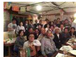
創る会（利用者）と生産者の懇親会 ～食べる会～