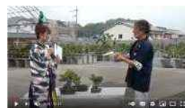
高松盆栽オークション 盆栽紹介ライブ配信