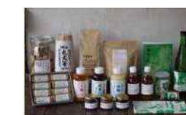
地域のみんなでつくる加工品の開発・製造