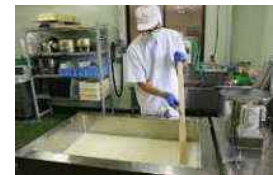
地元生乳 100%の手作りチーズは 国内外で高評価