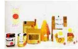
みとよのみプロジェクトで開発 された商品