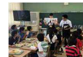
小学生との給食交流会