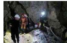
小学生の洞窟探検