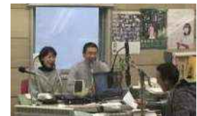
毎月1回 JRT(四国放送)ラジオで 活動等の情報発信