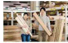
販売する端材製品のイメージ