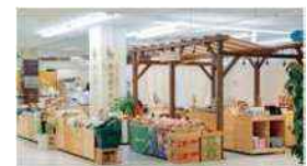
地元産マルシェ「LaLa フラン」