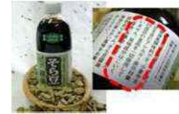
アレルギーフリーのそら豆醤油