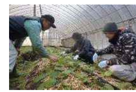
山口県農業士協会による研修