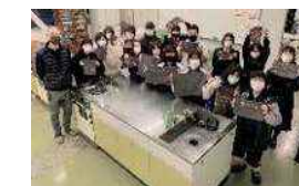
地元穴吹高校生との茶染め体験