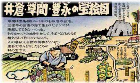
新たなガイドブックの作成