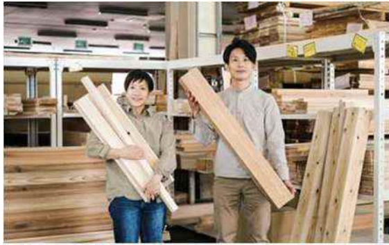
販売する端材製品のイメージ