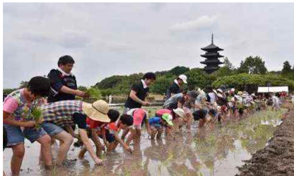
赤米の田植えイベント