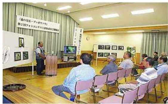
フォトコンテスト表彰式及び講演会