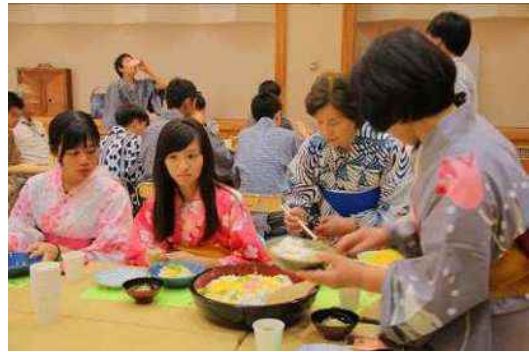
台湾高校教育旅行 ちらし寿司・浴衣着付け体験