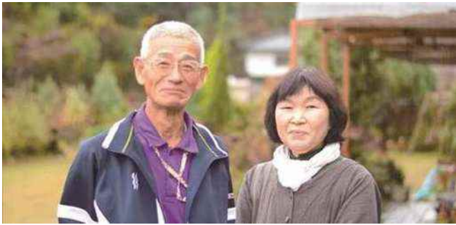
農家民宿 みっちゃん 夫婦