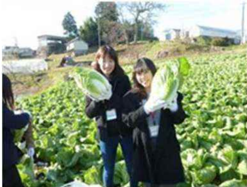
特産品収穫体験の様子