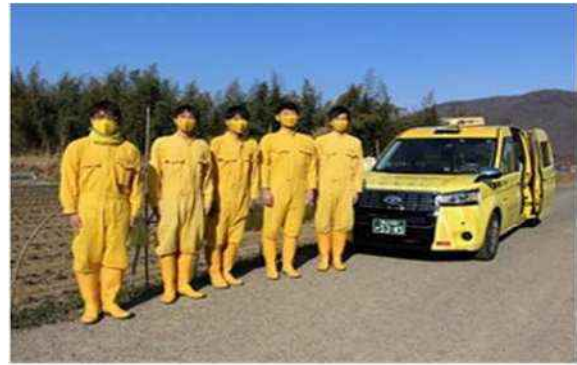
岡山交通株式会社タクシー乗務員と黄ニラ大使