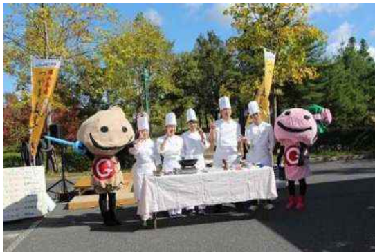
生徒企画・運営のつやましょうがまつり