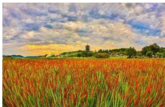
赤米フェスタ中の写真