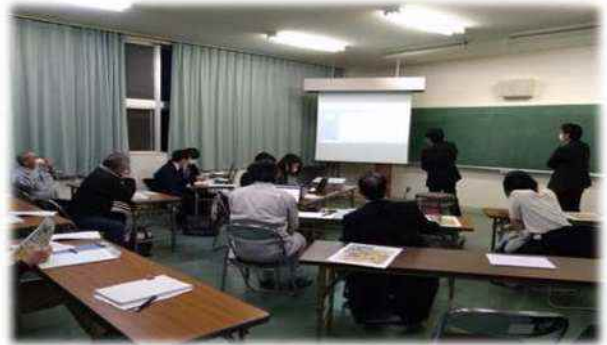
情報発信 ホームページのリニューアル