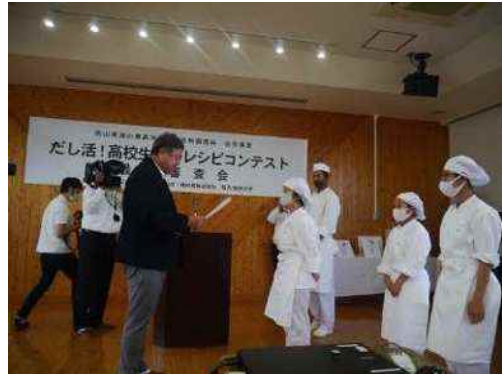
地産地消オリジナルレシピコンテスト