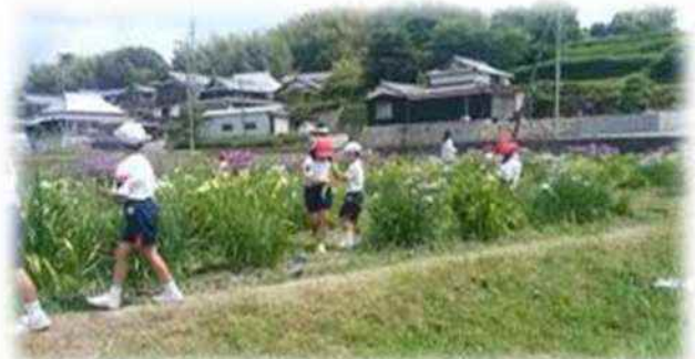
「花しょうぶ祭り」小学生招待