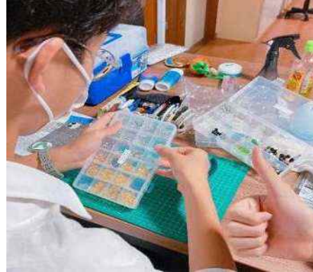
高校生の商品開発の様子