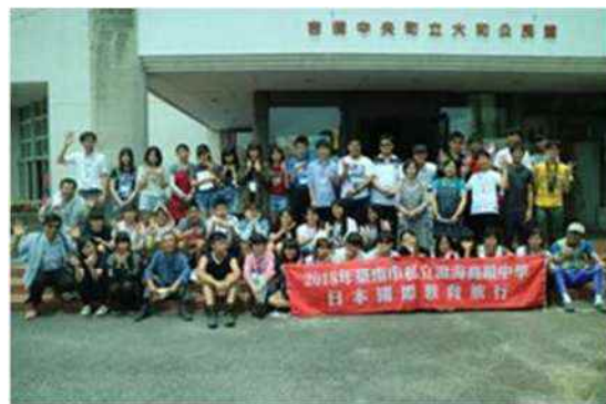
台湾高級中学の教育旅行受入の様子