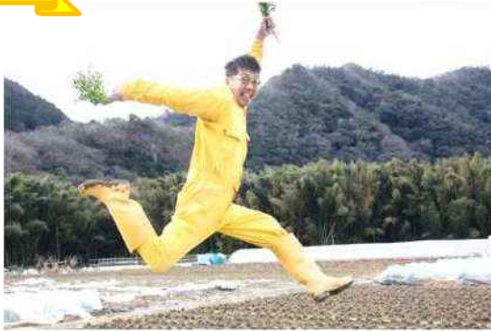
全身黄色！自称黄ニラ&amp;岡パク大使として活動