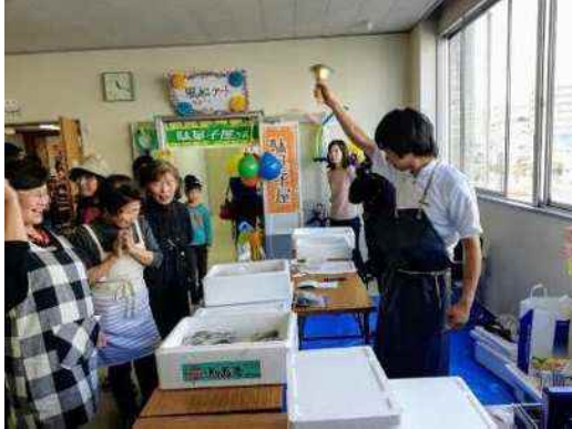
模擬せりイベントの様子