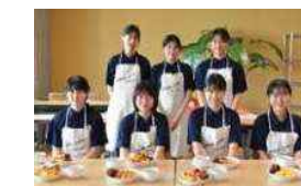
高校生ジビエ・レストラン出店