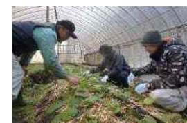
山口県農業士協会による研修