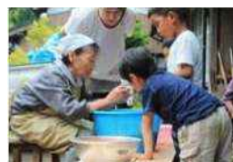
交流体験で梅ぼりを教える