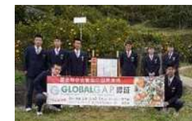
柑橘 11 品目でグローバルGAP 認証取得