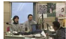
毎月1回 JRT(四国放送)ラジオで 活動等の情報発信