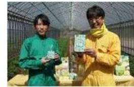
2021 年国和産業株式会社コラボ パクチャーゼリー完成