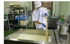
地元生乳 100%の手作りチーズは 国内外で高評価