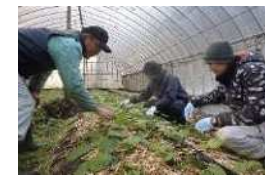
山口県農業士協会による研修