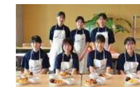
高校生ジビエ・レストラン出店