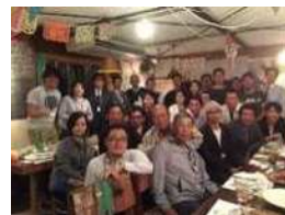
創る会（利用者）と生産者の懇親会 ～食べる会～