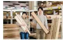
販売する端材製品のイメージ