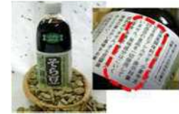
アレルギーフリーのそら豆醤油