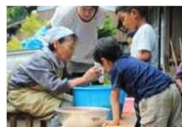
交流体験で梅ぼりを教える