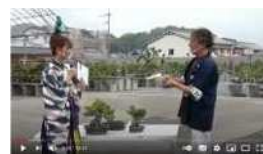
高松盆栽オークション 盆栽紹介ライブ配信