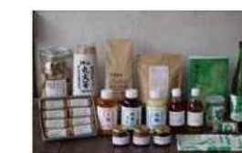
地域のみみなでつくる加工品の開発・製造