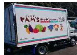
遠隔地の産物を集約する巡回トラック