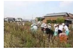
大野小 5 年生児童の「大野豆」 収穫作業