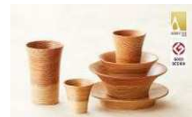
スギにしか出来ない赤白の杓目が 美しい木製品