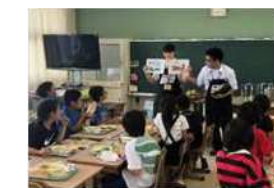
小学生との給食交流会