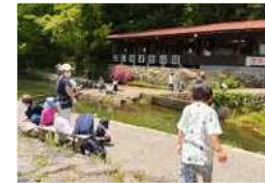
子供から大人まで楽しめる釣堀施設