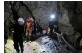
小学生の洞窟探検