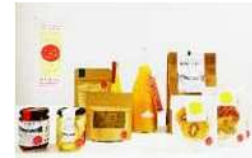
みとよのみプロジェクトで開発 された商品