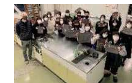
地元穴吹高校生との茶染め体験