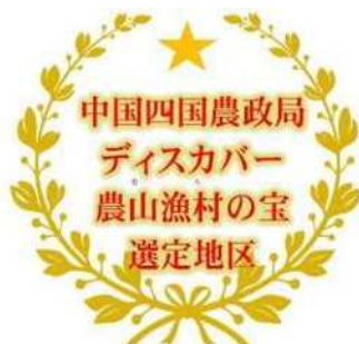
中国四国農政局「ディスカバー農山漁村（むら）の宝」 オリジナルロゴマーク