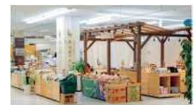
地元産マルシェ「LaLa フラン」