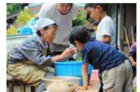
交流体験で梅ぼりを教える