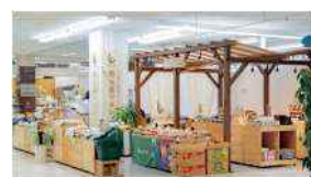
地元産マルシェ「LaLa フラン」