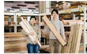
販売する端材製品のイメージ