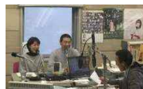
毎月1回 JRT(四国放送)ラジオで 活動等の情報発信