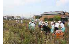
大野小5年生児童の「大野豆」 収穫作業