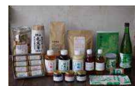
地域のみんなでつくる加工品の開発・製造