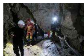
小学生の洞窟探検