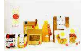
みとよのみプロジェクトで開発 された商品