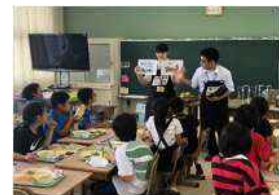
小学生との給食交流会