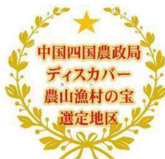
中国四国農政局「ディスカバー農山漁村（むら）の宝」 オリジナルロゴマーク