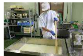
地元生乳 100%の手作りチーズは 国内外で高評価