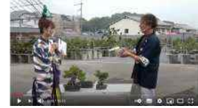
高松盆栽オークション 盆栽紹介ライブ配信