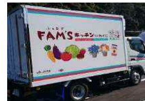
遠隔地の産物を集約する巡回トラック