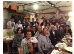
創る会（利用者）と生産者の懇親会 ～食べる会～