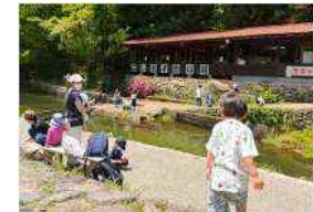
子供から大人まで楽しめる釣堀施設