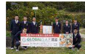
柑橘11品目でグローバルGAP 認証取得