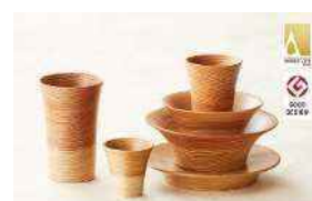
スギにしか出来ない赤白の柎目が 美しい木製品