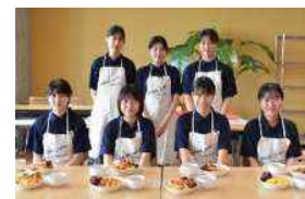
高校生ジビエ・レストラン出店