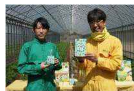
2021 年国和産業株式会社コラボ パクチーゼリー完成