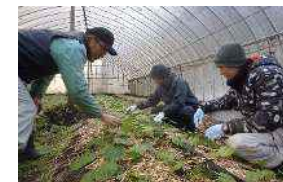
山口県農業士協会による研修