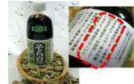
アレルギーフリーのそら豆醤油