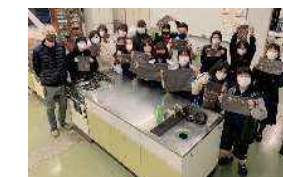
地元穴吹高校生との茶染め体験