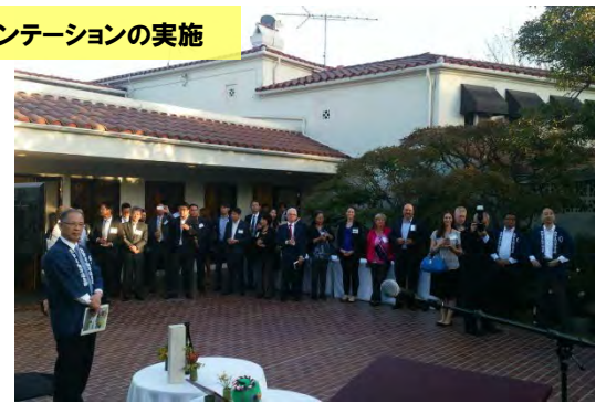
海外でのプレゼンテーションの実施