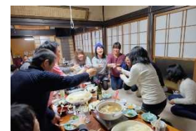
農家民宿体験ツアー