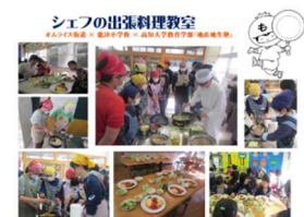
シェフの出張料理教室