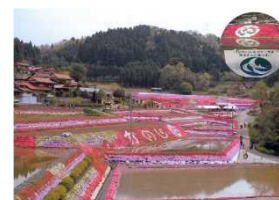
棚田に植栽されたシバザクラ