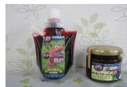
ボイセンベリーの加工品 (果汁・ジャム)