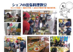
シェフの出張料理教室