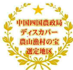
中国四国農政局「ディスカバー農山漁村（むら）の宝」 ロゴマーク

また、中国四国農政局管内での「ディスカバー農山漁村（むら）の宝」の応募喚起や他地域への横展開を推進するため、今年度新たに応募全地区（172地区）に対して参加証を発行するとともに、選定地区（17地区）に対して選定証の授与及びロゴマークを進呈することとしました。