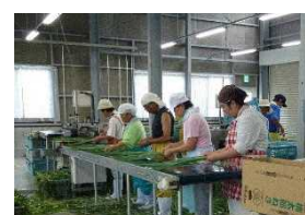
障がい者による青ネギの洗浄