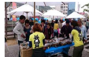
イベントでのマルシェの開催