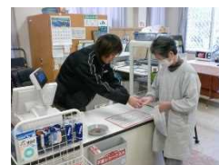
住民の出資により運営する 生活店舗