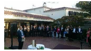
海外でのプレゼンテーションの実施