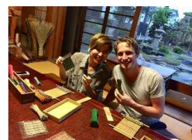
インバウンドの拡大 (い草ワークショップ)