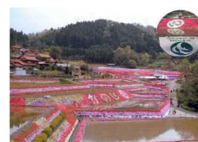
棚田に植栽されたシバザクラ