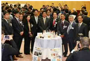
「ディスカバー農山漁村（むら）の宝」交流会

中国四国農政局管内から優良事例として6地区が選定され、特別賞のフレンドシップ賞（インバウンドに対応した農山漁村滞在型旅行（農泊）に取り組んでいる優良事例）に徳島県三好市の「大歩危・祖谷いってみる会」が選定されました。