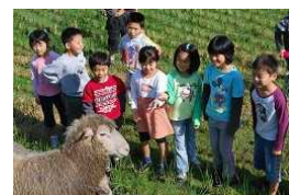
羊とのふれあい体験