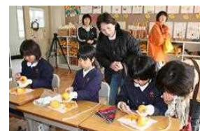
出前授業（干し柿づくり）