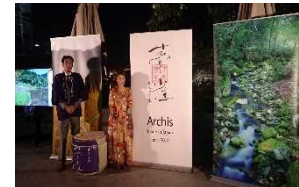
海外での日本酒プロモーション