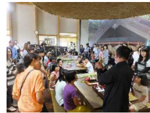
しめ縄づくり体験