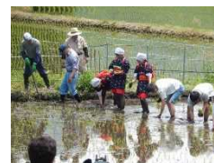
島根大学との交流