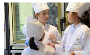
体験スタジオ（パティシエ体験）