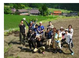
里山案内ツアー（アワの栽培体験）