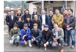
安心安全なジビエをPR