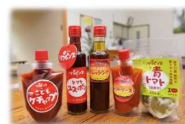
遊子川トマトを使用した加工品