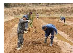
ユズの苗木植付作業