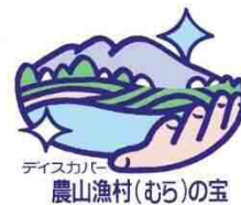
「ディスカバー農山漁村（むら）の宝」ロゴマーク