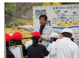
小学校現地見学・学習活動