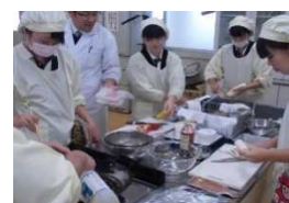
地元の魚を利用した食材調理実習