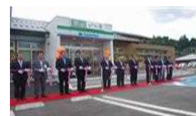
郷の駅開業イベント