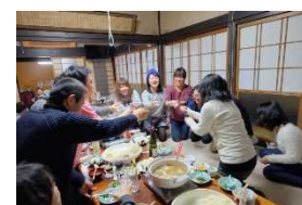
農家民宿体験ツアー