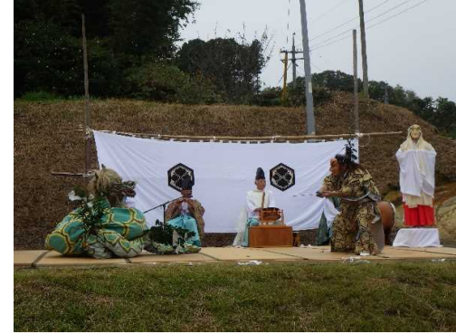
棚田祭り。神楽を多くの人が楽しみに。