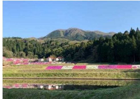
雄大な自然の中に映えるシバザクラの花絨毯