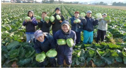
せわやき隊メンバー