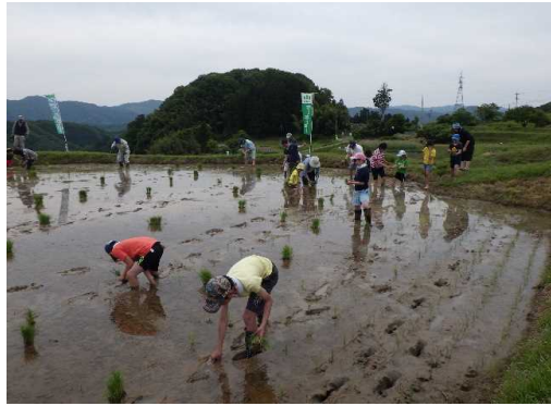
手植えとババ引き体験中