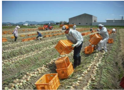
玉ねぎの収穫作業