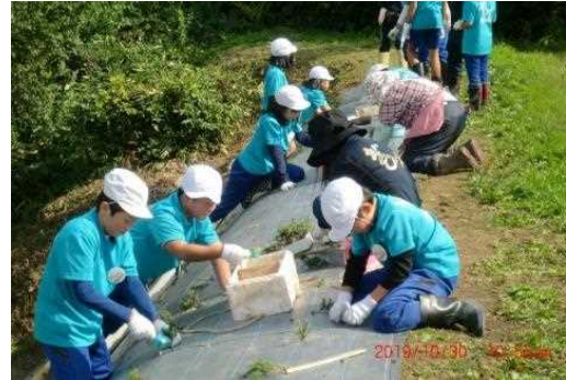
小学生のシバザクラ植栽体験学習の様子