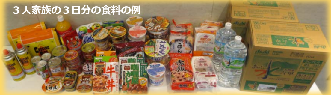
3人家族の3日分の食料の例

今回の消費者の部屋特別展示では、災害の発生に備え、各家庭でできる食品等を備蓄するポイントや簡単にできるローリングストック等を紹介합니다。