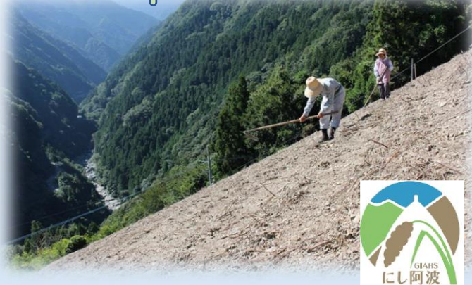
にし阿波地域（徳島県）