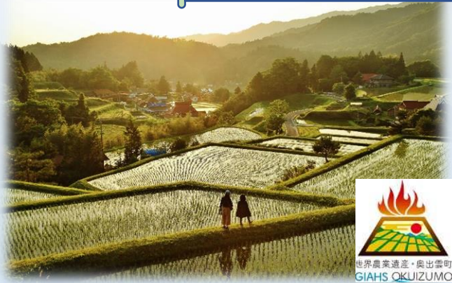
奥出雲地域（島根県）