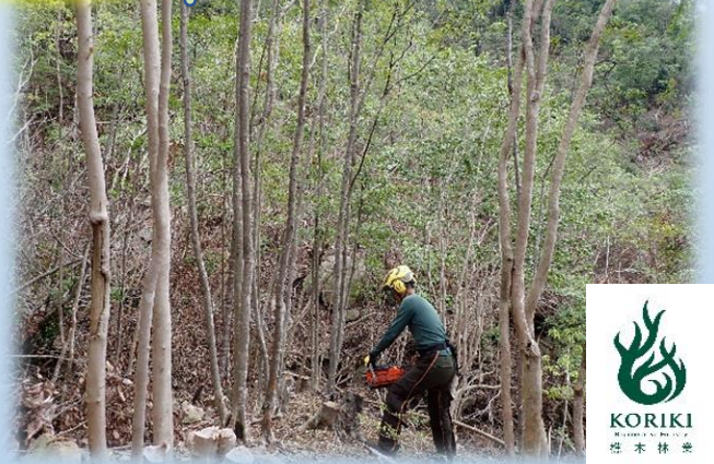
徳島県県南地域（徳島県）