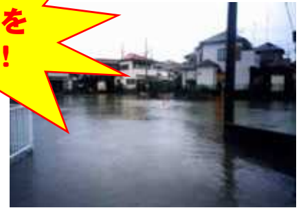
台風による市街地内の農業用排水路の溢水