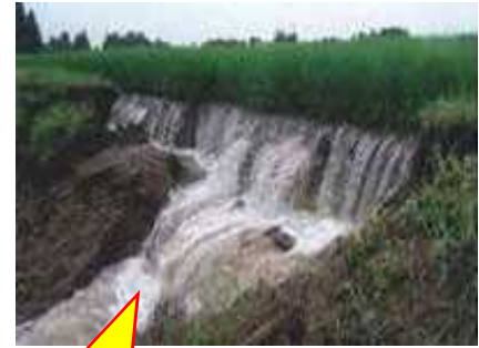
集中豪雨による畦畔の崩壊