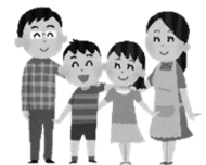
高齢農業者 の家族等