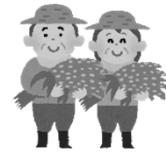
高齢農業者 (家族や知人)