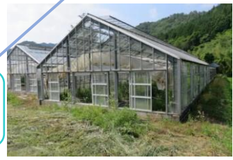
出品されているハウス（調査時点） サイト上では、面積・築年数・前作物・立地状況等の情報を得ることができる。

★施設の情報を入手したら、使用の可否を市町および公益財団法人やまぐち農林振興公社が 確認の上、アグリレーに掲載 することで、 安心して継承 できる。