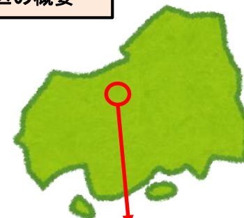
広島県安芸高田市 安芸高田(クリーンカルチャー)地区