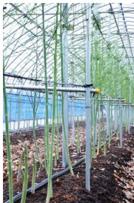
アスパラガス栽培