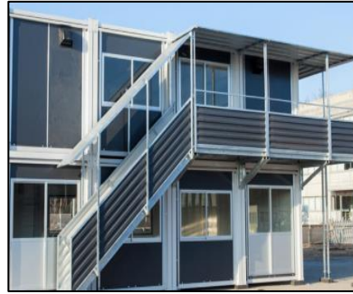
ハウス備品事業本部