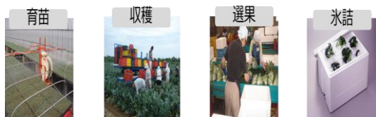
・ブロッコリー大規模栽培により育苗～出荷まで自社で実施