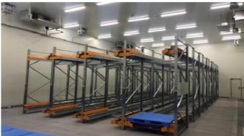
・産地型の高機能冷蔵倉庫