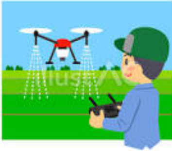
農業用ドローン教習所