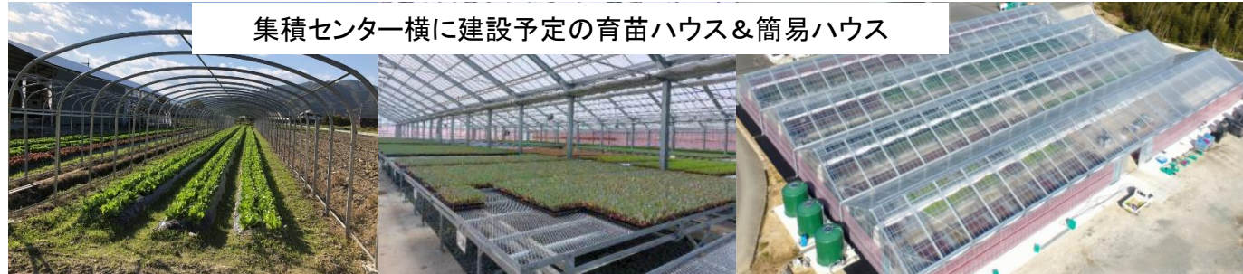
集積センター横に建設予定の育苗ハウス&簡易ハウス