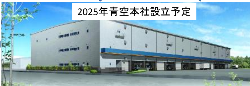
2025年青空本社設立予定