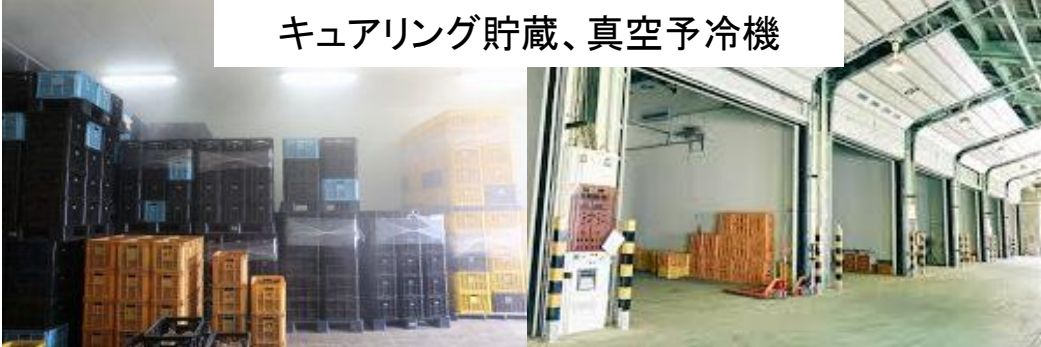
キュアリング貯蔵、真空予冷機