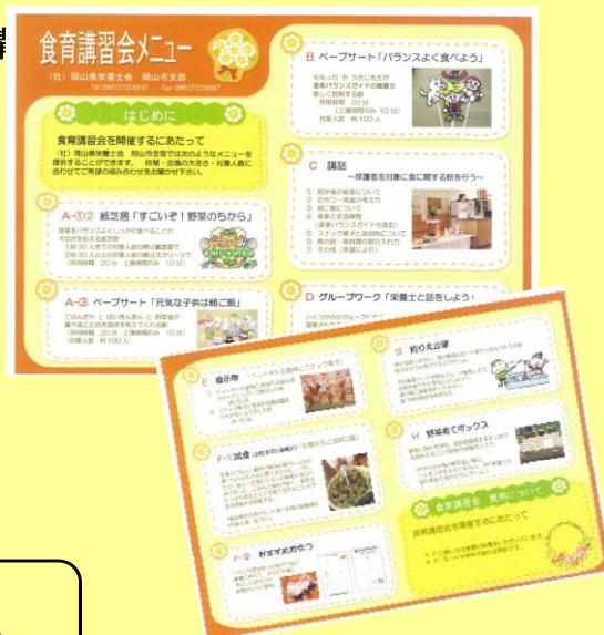
▲岡山市支部作成「食育講習会メニュー」