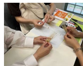
収穫した大麦・ブルーベリーを使用して調理