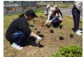
畝立 & 苗植え