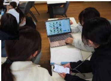
草マルチのレクチャーを受ける様子