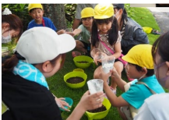
地域の保育園とコラボレーション

学生たちは、自らの栽培体験と様々な学問分野を連関させながら、岡山の食文化も取り込んだ幼児向けの食育プログラムの作成に励んでいます。学生が地域の保育園、社会福祉法人、企業等と協力してプログラムを実践し、効果の検証や内容の変更、修正を行っています。将来保育者になる学生たちが、食育プログラムの作成を通して食に関する横断的知識を得ることは、子どもたちの生涯にわたる心身の健康を支える食育活動への寄与に繋がります。